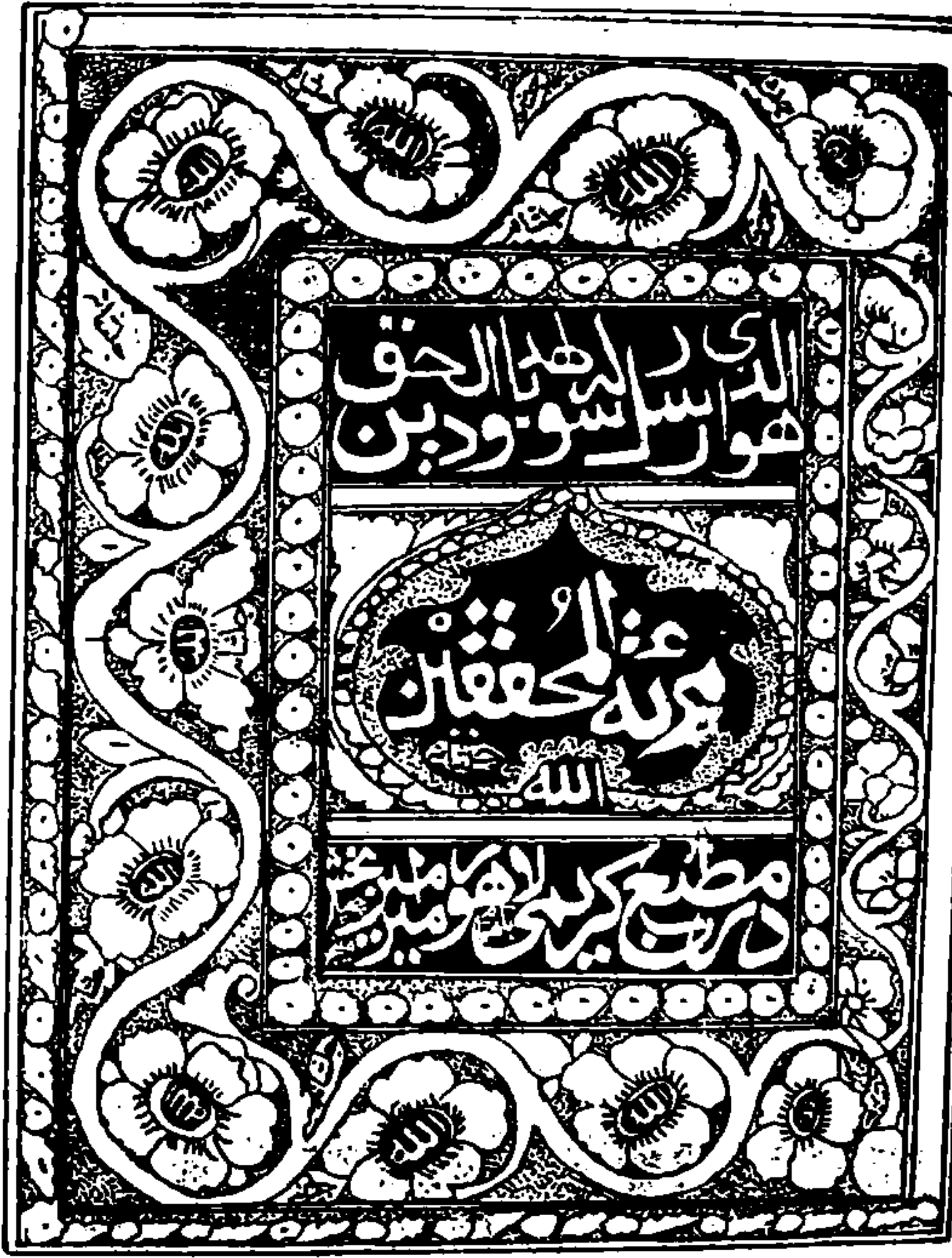
عكس مرآة المحققين صفحة اول