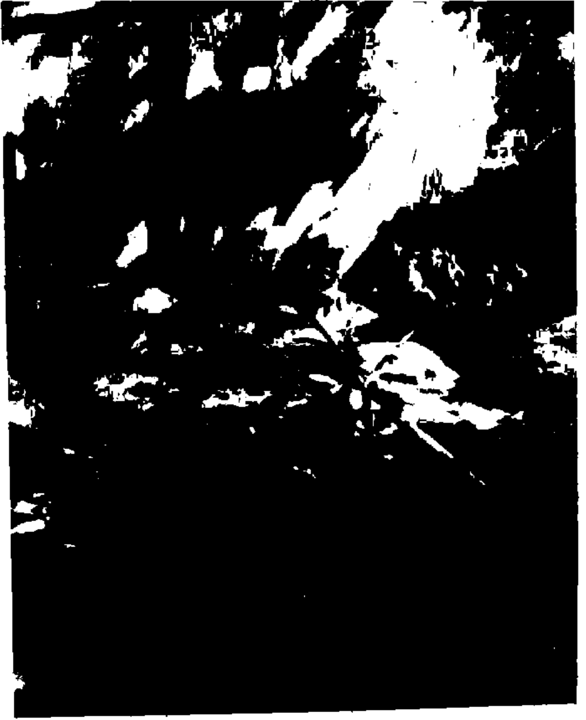
مزار مبارک حضرت فقیہ الہند شیخ محمد مسعود شاہ محدث دہلوی درگاہ حضرت خواجہ باقی باللہ دہلی